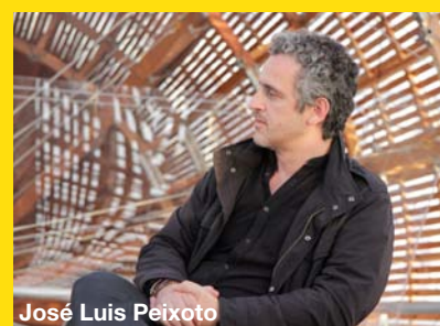
José Luis Peixoto